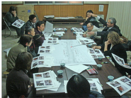
石川商店街環境整備支援事業 実施設計