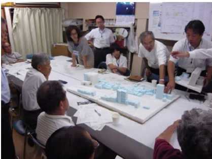
神奈川県・浦島町 共同建替え検討