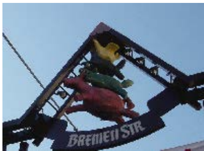
川崎トスプレーメン通り商店街 リニューアル整備工事 設計・監理