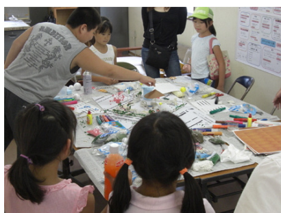
鶴見区・市場西中町 きらきら公園整備